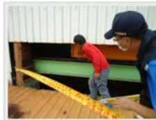
工作人員指出，邱男疑似在更換鐵皮，不慎被天車夾爆頭。(記者陳冠偉攝)

今日下午檢察官到現場相驗，死因為頭部開放性骨折併大腦迸出，警方依過失致死罪嫌將鄭男移送偵辦。