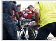
消防人員將人救出後送往醫院急救。