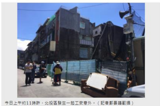
今日上午約11時許，北投區發生一起工安意外。