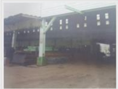
工廠更換鐵皮，卻不慎傳出工安意外。

警方調查，昨天上午11點，邱姓工人到北斗工業區的工廠進行屋外鐵皮更換作業，此時廠區鄭姓工人(35歲)也啟動軌道移動吊貨機具，天車隨著軌道移動到一半，邱男卻突然從工廠二樓窗口探頭進來準備焊接，不僅不備剛好撞倒，邱男頭部遭到夾擊，腦漿當場迸出，無生命跡象，身體卡在二樓頂，花費一段時間才搬下來，送往北斗卓醫院救治，但到院時已死亡。