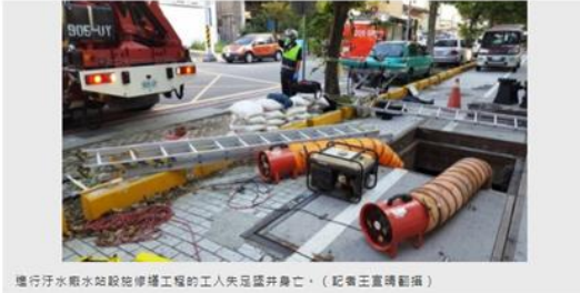
進行汙水廠水站設施修繕工程的工人失足墜井身亡。(記者王重禎翻攝)