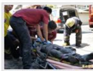
消防人員將人救出後送往醫院急救。