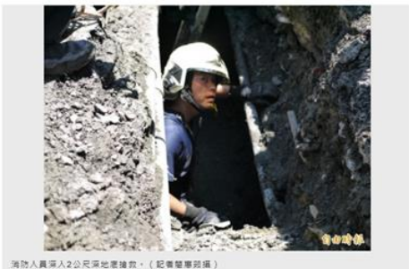
消防人員深入2公尺深地處搶救。