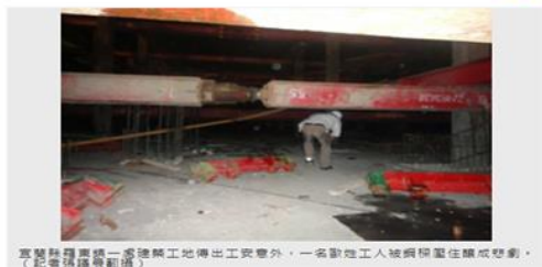
宜蘭縣羅東鎮一處建築工地傳出工安意外，一名動地工人被鋼樑壓頂造成悲劇。