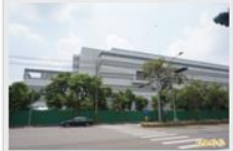
台灣美光記憶體股份有限公司位於台中一廠對面的新建廠房地傳出工安意外。(記者謝美英攝)

【記者謝美英 / 台中報導】台中市后里中科園區的台灣美光記憶體股份有限公司新建廠區，廠商採用液壓拖板車運送配電盤時，疑未妥善綁紮處理，致拖板車進入貨梯時，高約2公尺的配電盤突然滑脫壓傷負責控制貨梯的董姓女員工，董女經送醫不治，中科管理局表示，目前全案已朝工安意外進行調查中。