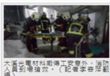
大溪光電材料廠傳工安意外，消防人員到場搶救。

工廠內員工發現後，立即將機體切斷電，並試圖把他拉出來，趕緊打119電話求救，消防人員到場時，移工雖開放性骨折，仍有意識，但因機體卡住卸不易，消防人員用砂輪機破壞機具，花了近1個小時才把人救出送醫。