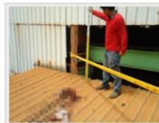
邱男被夾頭部腦漿迸出，現場血跡斑斑。