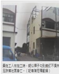
高姓工人在施工時，褲子鉤到鐵釘不慎失足墜落地面身亡。

【記者陳冠博/彰化報導】彰化縣溪州鄉中西路一處工地昨日發生一起工安意外，57歲的高姓工人在施工時，不慎從3樓高的外牆墜落地面，黃男當場失去意識，經救護車送往醫院急救仍不治身亡。現場工人表示，本來還好好走在外牆擺錘，不知什麼原因就從他摔下去了。