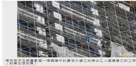
台南安平五期重劃區一棟興建中的豪宅大樓工地傳出工人墜樓身亡的工安意外。