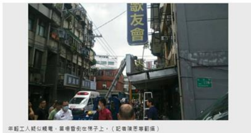
車前工人疑似觸電，當場昏倒在梯子上。