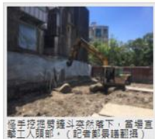
怪手挖機鏟斗突然落下，當場直擊工人頭部。

【記者鄭景禧 / 台北報導】今日上午約11時許，北投區發生一起工安意外，一名67歲的林姓工人， 擅自去砍掉二路95巷一處建築工地內運行地盤鬆平土機時，一旁高懸的怪手挖機鏟斗突然落下，當場直擊工人頭部，工人頭部流血倒地不起，一旁民眾見狀通報消防送醫，但送醫時工人已無呼吸心跳，到院前已死亡。