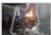
大溪光電材料廠傳工安意外，消防人員到場搶救。

【記者李睿萍 / 桃園報導】位於桃園市大溪區仁壽里的新科光電材料公司，今天上午6時許發生工安意外，41歲的移工在搬運片邊碎渣清理機時， 疑似因為機身突然轉動，雙腿不穩被捲入機體，移工遭撞擊，但仍遭捲入機體拉倒，整個人半身被卡在這裏動彈不得。