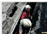
消防人員深入2公尺深地處搶救。