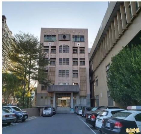
新北地檢署。