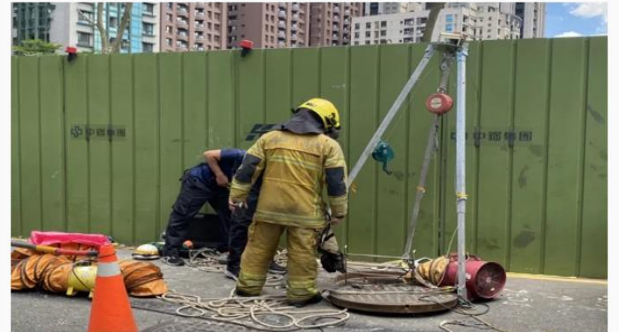
消防獲報到場，當時林姓工人已被其他同事救出，消防員在現場檢測有無異常氣體，但傍晚傳出林男宣告不治。

林姓工人疑因吸入過多沼氣，送醫搶救一個多小時，於傍晚5時8分許，宣告不治；水利局職安人員和勞檢人員將配合警方調查整起工安事故發生原因。