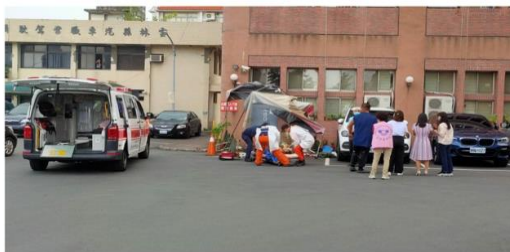
李姓冷氣工墜樓，救護人員趕地搶救送醫

雲林縣政府17日發生工人墜樓意外，48歲李姓冷氣工人爬出縣府社會大樓4樓外安裝冷氣室外機，不慎墜樓，從4樓墜落1樓地面，雖先掉落在幼兒托育中心設置戶外帳篷上，但因衝擊力道太大，整個人猛力撞破帳篷後又砸向地面，頭部受到重創，傷勢相當嚴重，經緊急送往台大醫院急救後仍宣告不治，斗六警方正到場調查整起意外，雲林縣府社會處表示了解後將追究包商責任。