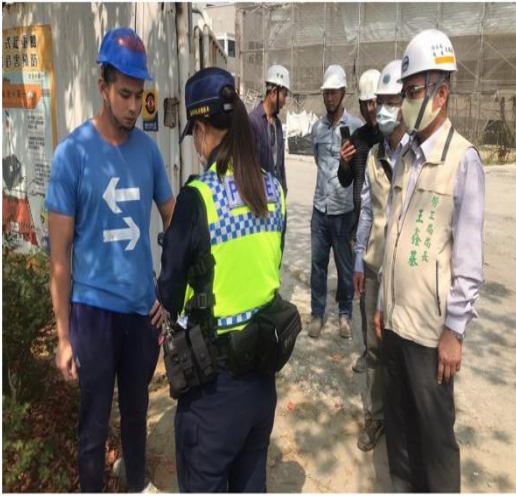
清明連假期間，南市勞工局仍在各重要工地加強酒精測試。

從事高架作業的工人需要高度注意力及平衡力，工作前不能飲酒，否則容易發生墜落危險。台南市勞工局五日強調， 雇主應嚴格禁止勞工在工作前、中飲酒，若未善盡指揮監督責任，以致發生工安意外事件，將依法處最高三十萬元罰鍰。