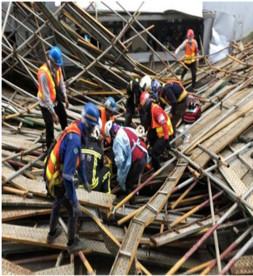
大潭電廠8號機組外牆鷹架，突然發生倒塌意外，有6名工人受傷。