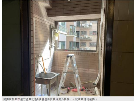
蔡男在桃園市蘆竹區某社區9樓替住戶安裝冷氣外掛機。

經通知救護車到場，於下午4點10分將他送往林口長庚醫院急救，昨天下午4點44分，經急救蔡男仍無恢復生命跡象，宣告不治。