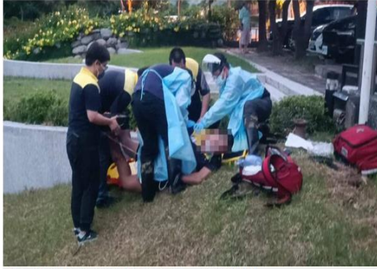
救護人員據報趕抵，發現倒地的周男已無生命跡象。