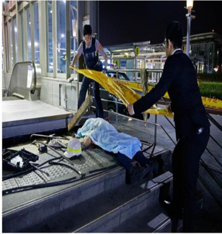
台北市松山機場捷運站2018年工安意外，造成1名女工人頭部撞擊門窗墜落死亡。