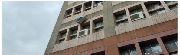
李姓冷氣工在四樓窗外施工不慎墜樓

許多洽公民眾聽到劇烈碰撞聲響後跑出查看，驚見工人傷勢嚴重趕緊通報119前來救援，雖然事發現場緊鄰台大醫院，但經醫院搶救半小時，仍李男後腦勺著地傷勢太過嚴重，宣告不治。