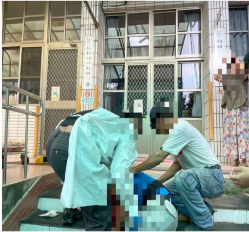
李男拆除、更換校舍遮雨棚，不慎踩破採光罩揮落，頭部撞擊階梯銳角，送醫傷重不治。