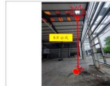
說明：罹災者踏穿塑膠浪板採光罩墜落至地面，墜落高度為8.8公尺；於採光罩下方未於適當範圍裝設圍欄或安全網等防護設施。