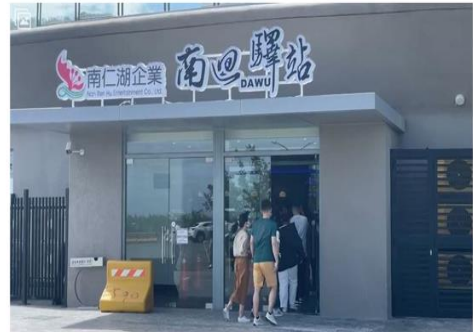
▲所幸維修工緊急送醫後，意識清楚，暫無生命危險，南迴驛也恢復試營運。

據了解，南迴驛預計這個月20日開幕，目前已開始試營運，內部各商家也正緊鑼密鼓準備中，早上8點多，有外包廠商一名維修工進行電路維護時，疑似總開關未關閉，使用工具時不慎觸電，瞬間產生火花，導致維修工嚴重燙傷意外。