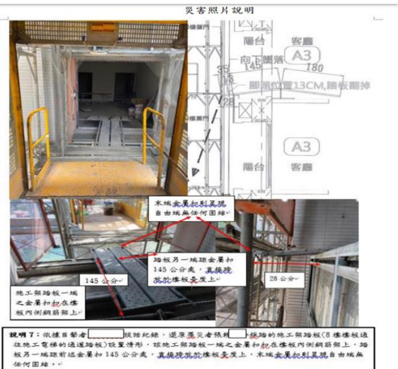
說明了：依據目擊者張朝○○張朝○○，還原罹災者張朝○○採踏的施工架通道(8樓樓板通往施工電梯的通道踏板)設置情形，該施工架通道一端之金屬扣起在樓板內側鋼筋梁上，另一端一端則前述金屬扣和145公分處，真饒就於樓板上，木板金屬扣則真饒自由端無任何圍鎖。