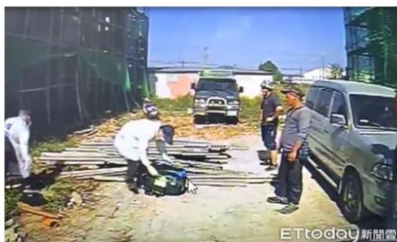
▲嘉義縣民雄鄉工安意外。