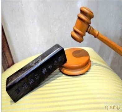
吳男高空作業缺乏安全防護，不慎摔落重傷，雇主及工地負責人判賠。(資料照)