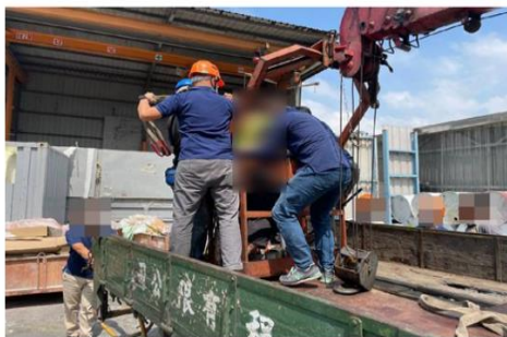
▲高雄工人觸電身亡。