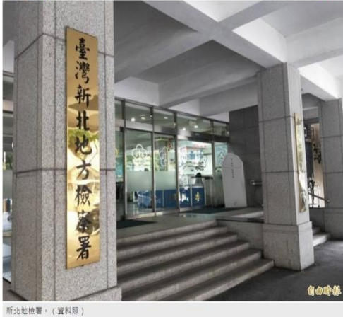
新北地檢署。(資料照)