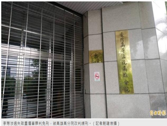
李等涉過失致重傷獲判免刑，被高雄高分院改判徒刑。