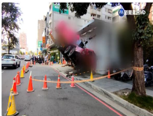
台中市 / 林佳瑩 蕭廷偉 報導

台中西區五權西路上一處工地，發生工安意外，一台起重機在進行吊掛作業時，疑似因為外伸撐座有一邊沒有伸好，導致重心不穩，整台起重機側翻，四輪離空，而一旁就是車來車往的大馬路，讓用路人看了覺得好危險，起重機司機第一時間受困在駕駛座上，被緊急救出。職安署表示，業者已經違反職業安全衛生法，將會裁罰最高30萬元。