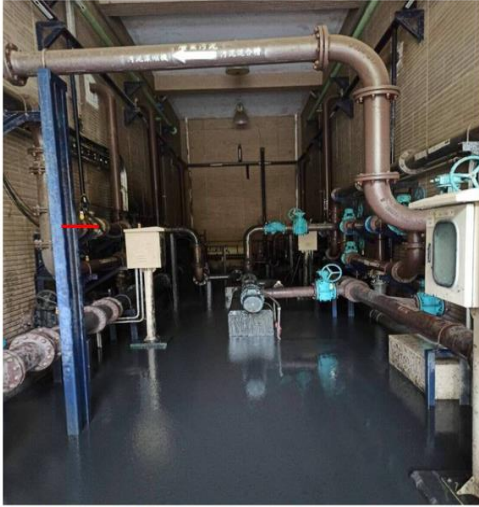
中科污水處理廠今天在機房進行汙泥管更換作業，疑似因過量的沼氣溢散，造成2名工人昏厥送醫，所幸都清醒恢復意識。