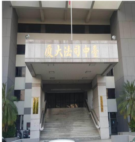
彭在機械技師於2020年開工電切香薰空鐵桶，導致爆炸事件，案中其謀殺、雇主連環槍、一審、二審都判6月，得易科罰金。(本報資料照)