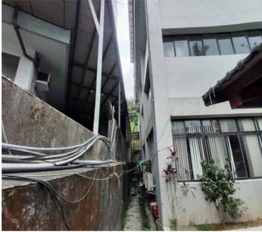
周男進行維修外牆磁磚時，不慎墜落1樓身亡。