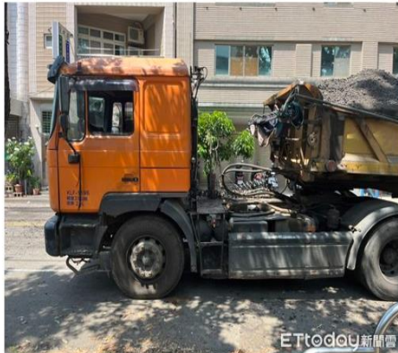
▲台中道路刨除工程，1男遭同事倒車輾斃身亡。