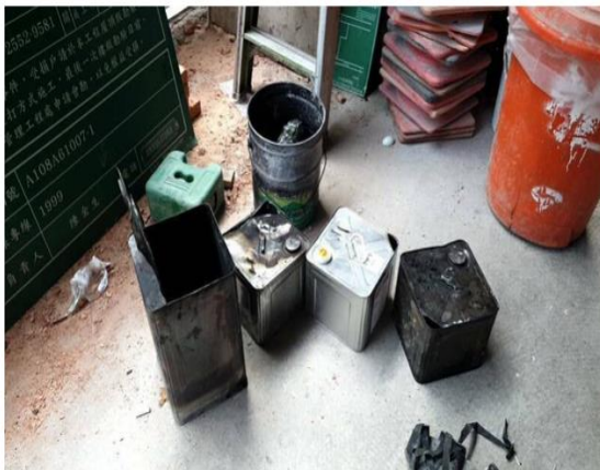
起火原因疑似為油漆混合甲苯時有人在旁抽菸。