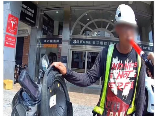
潘姓男子戴工程帽上路，酒測值超標。

經實施酒測，因潘男酒測值達每公升0.28毫升，超過法定標準值，涉犯公共危險罪嫌遭到逮捕，警方當場扣繳他的機車牌照及移置保管車輛，將他帶返派出所法辦。