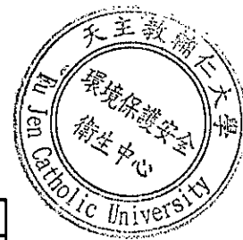
輔仁大學水質檢驗結果一覽表