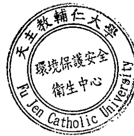
輔仁大學水質檢驗結果一覽表